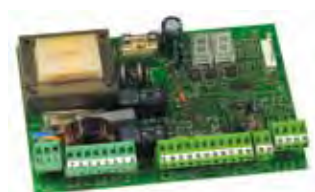
Motorsturing 455 D Technische spec. zie Pag. 187