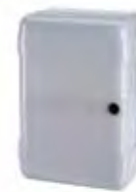
Huizing mod. LM voor motorsturing (afm. h 353 x b 246 x d 141)