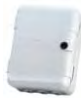
Huizing mod. L voor motorsturing (afm. h 265 x b 210 x d 115)