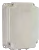
Huizing mod. E voor motorsturing (afm. h 265 x b 204 x d 85)